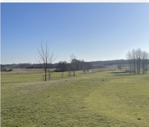
Træer plantet ud mellem hul 15 og 16

I tilfælde af nattefrost her i starten af sæsonen kan vi have dage, hvor vi spiller til vintergreens nogle timer fra morgenstunden. Når det er tilfældet, vil det fremgå af Golfbox og af skilt på 1. tee.